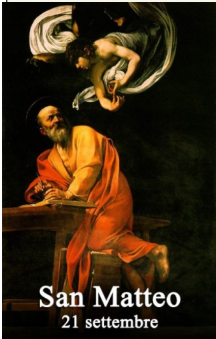
San Matteo 21 settembre

Matteo, esattore delle tasse in Cafarnao di Galilea lascia tutto al richiamo di Gesù: "Seguimi". Gli evangelisti Luca e Marco lo chiamano anche Levi, ma gli danno il nome di Matteo nella lista dei Dodici scelti da Gesù come suoi inviati: "Apostoli". E con questo nome egli compare anche negli Atti degli Apostoli.