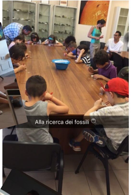
Alla ricerca dei fossili