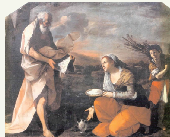
Il profeta Elia e la vedova

XXXII DOMENICA TEMPO ORDINARIO (ANNO B) 1 Re 17,10-16; Sal 145; Eb 9,24-28; Mc 12,38-44